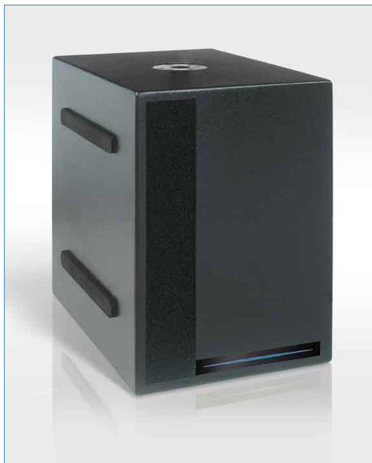
Enceinte de basse SUB138PS

Ces subwoofers nécessitent impérativement l'emploi d'un processeur APG. Tous les processeurs de la gamme possèdent une sortie mono "sub".